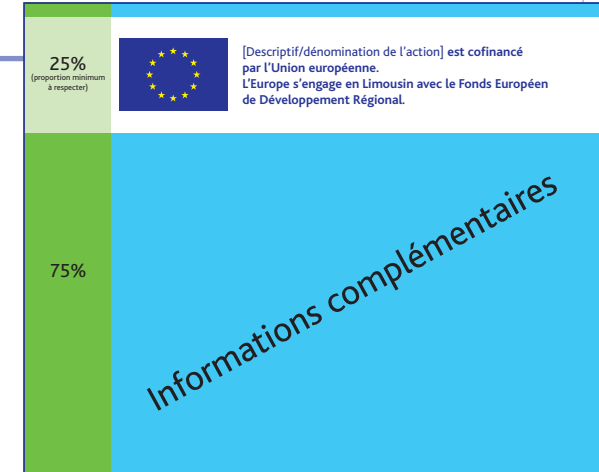
Exemple de maquette